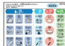
コミュニケーションボード