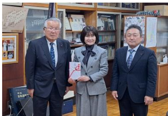
（左から）荒佐荒野社長、銚田第一高等学校・附属中学校飯山校長、銚田支店小田木支店長