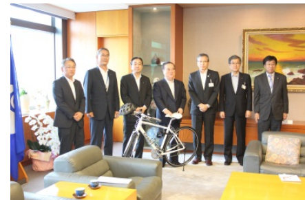
（茨城県への記念品贈呈式の様子）