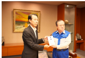
（茨城県への義援金寄贈式の様子）