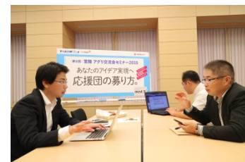
(アグリ交流会セミナーの様子)

今回は新事業創出をテーマとして取り上げ、当行が新事業創出支援の一環として取り組む「常陽ビジネスアワード」受賞先による事業プラン発表会のほか、アグリビジネス事業に対するファンづくりや資金調達方法として、「クラウドファンディング(ふるさと投資)」の活用方法に関する講演を行いました。