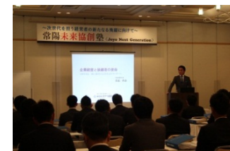
(第1回勉強会の様子)

当塾では、経営幹部に必要な実践的知識とスキルを習得いただくほか、地域を牽引するリーダーとしての人脈形成、交流の場としても有効にご活用いただけるものと考えております。今回は、第1期生として29名の方々に参加いただき、10月に開講いたしました。