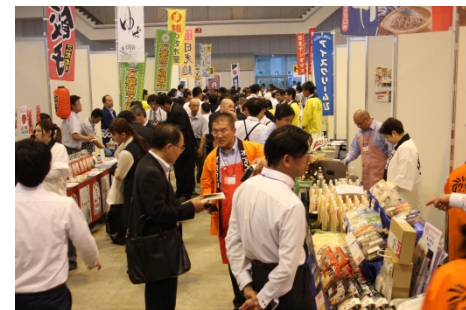
(アグリフードフェスタ2015in宇都宮会場の様子)

本事業は、北関東自動車道の全線開通から4年が経過し、茨城県、栃木県、群馬県の商流・物流が活発化するなか、3行が協力して取り組むことで経済圏域の拡大や観光振興に寄与することを目的としており、今回は食関連事業者の販路拡大を支援する商談会を開催しました。展示企業数は320社を数え、当日は約3,200名が来場した他、予約商談参加バイヤー185先との間で470件の商談が実施される等、盛大に開催されました。