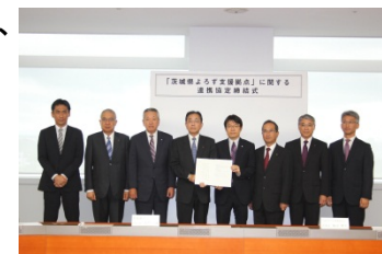
(連携協定調印式の様子)

人口減少や社会構造の変化等に伴い、企業の経営課題が多様化するなか、中小企業振興公社および県内の各金融機関が相互に連携し、地域における金融機能の高度化を図ることで、中小企業の経営支援・事業支援に積極的に取り組んでまいります。