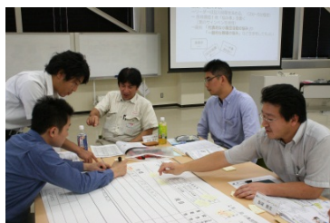
(製造業実務研修会の様子)

今回は、日立建機(株)の現職社員が講師となり、茨城県内外の中小製造業13社、21名の参加者の方々に、職場での小集団活動※2における問題解決の方法を学んでいただきました。