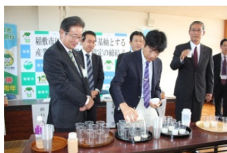
(協定締結式の様子)