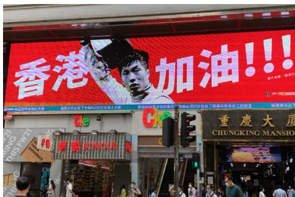
<繁華街のデジタル広告（フェンシング選手が出演）>

前回大会までの香港の通算メダル獲得数は3個だけでしたが、今回は、金1個、銀2個、銅3個の合計6個と史上最高の結果でした。開幕間もなく、フェンシングが金メダル、水泳が銀メダルを2個獲得し、大きな話題となりました。その後も、卓球団体と空手が同日に銅メダル、最終日にも自転車が銀メダルを獲得し、香港中が熱狂しました。開催期間中は、ショッピングモール内のモニターに競技が放映され、人だかりができるほどで、東京オリンピックによって、香港に活気がもたらされました。