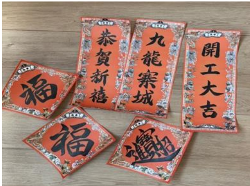
<揮春（ファイチョン）>