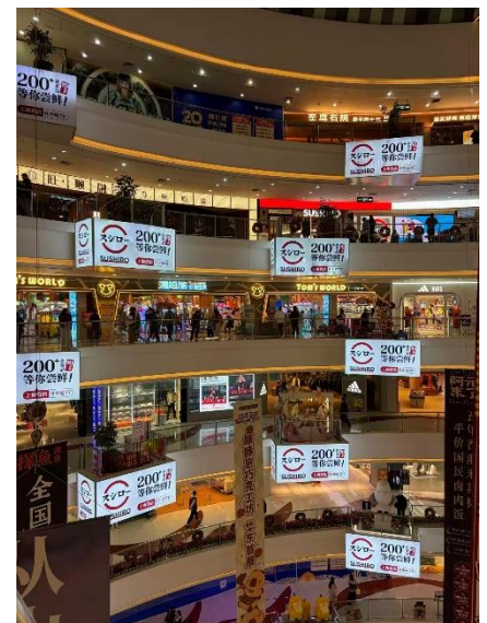
モール内はスシロー一色