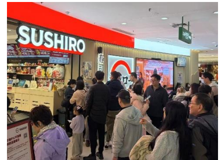
店舗前は大行列